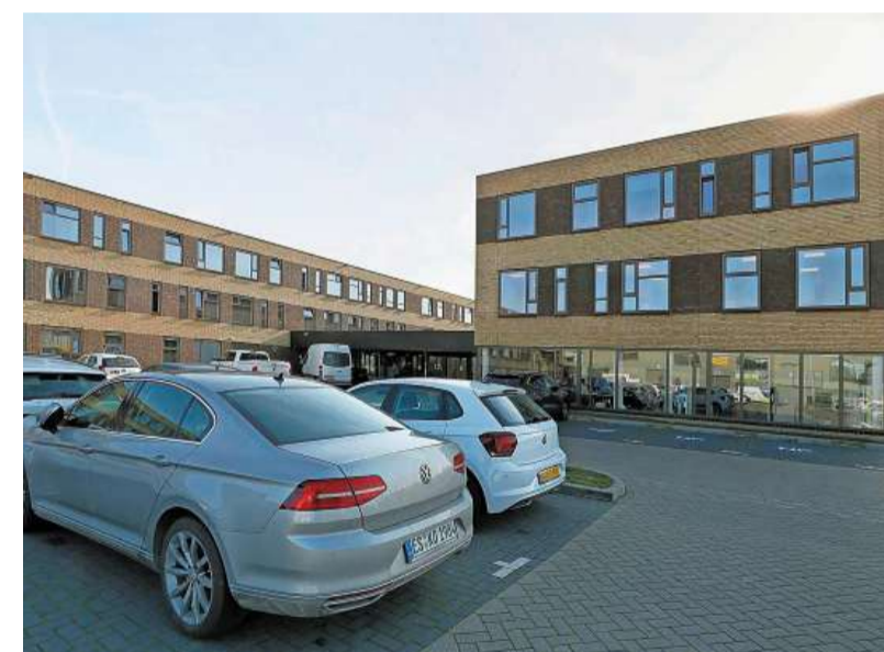
Het Logiescentrum op Agriport.

„ Ik vind de vorm ook goed, een carrévorm met in het midden plek om buiten te recreëren. Op die manier heeft de omgeving er geen last van als bewoners zich buiten vermaken